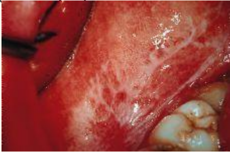
Liquen plano reticulado